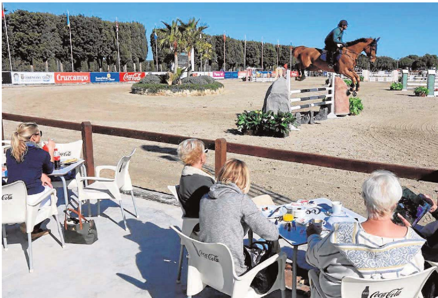
El ocio y el deporte se mezclan los días que dura la celebración de este evento hípico, convirtiéndose incluso en una seña de identidad que ha marcado