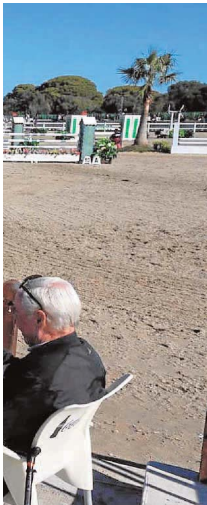
su evolución desde que nació.