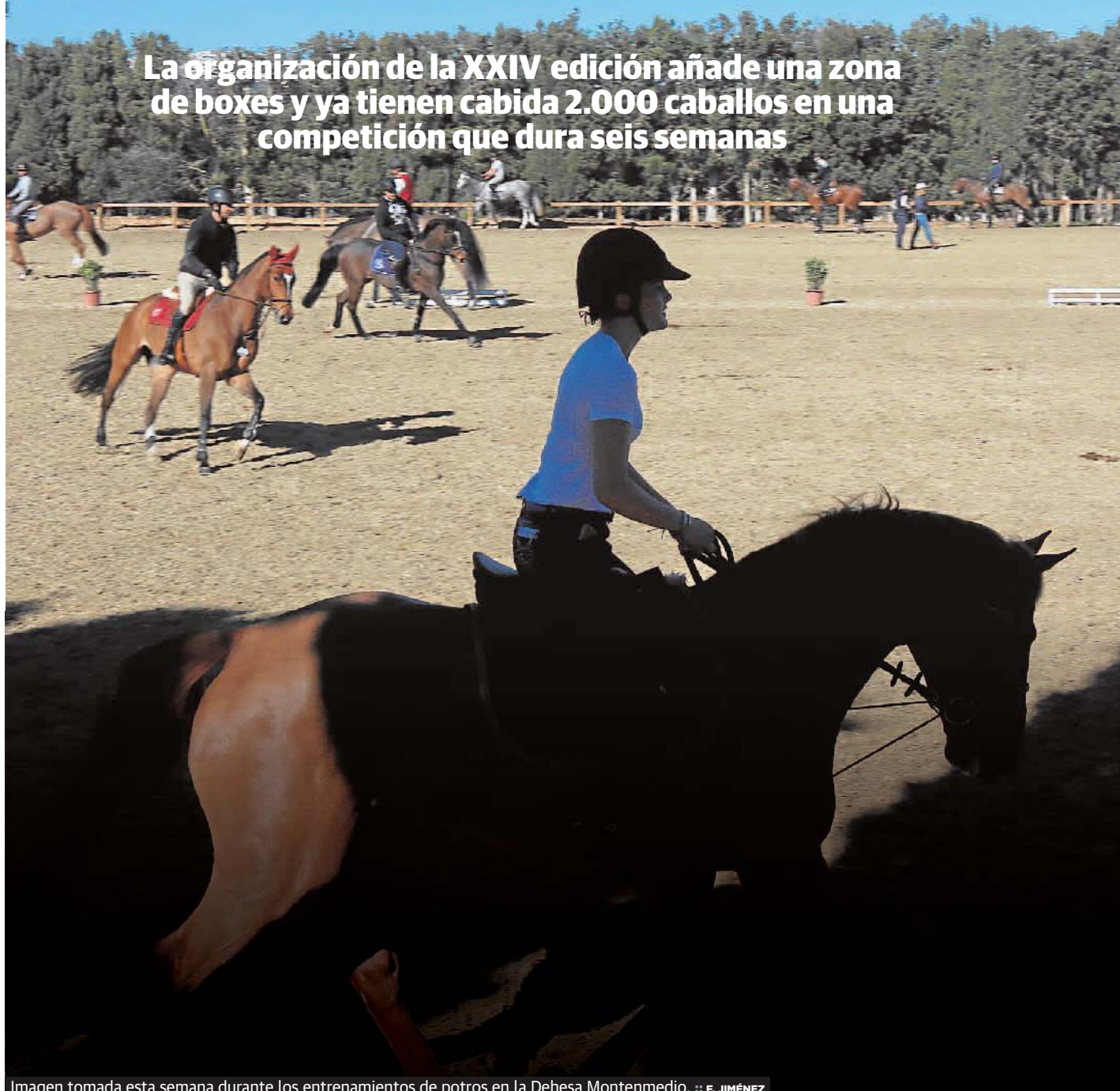
Imagen tomada esta semana durante los entrenamientos de potros en la Dehesa Montenmedio.

La organización de la XXIV edición añade una zona de boxes y ya tienen cabida 2.000 caballos en una competición que dura seis semanas