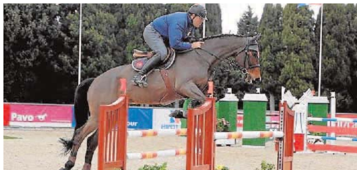
El Circuito Hípico del Sol vuelve a entrar en escena. :: ANTONIO VÁZQUEZ

Pero, sin duda, el grueso de la competición al más alto nivel comenzará el próximo martes y será cuando el Circui-