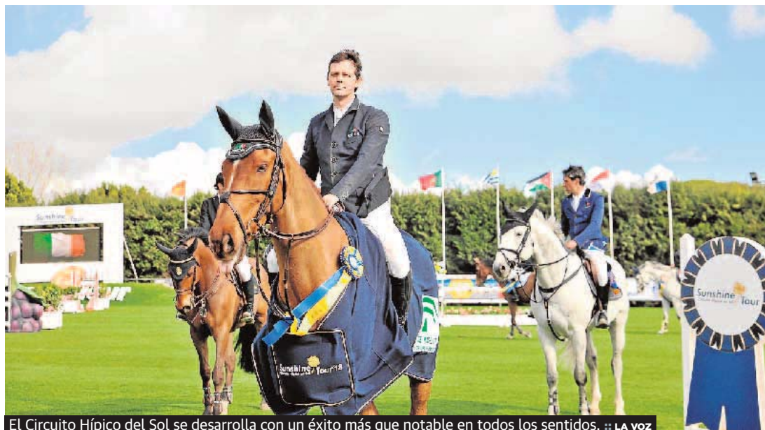
El Circuito Hípico del Sol se desarrolla con un éxito más que notable en todos los sentidos. :: LA VOZ